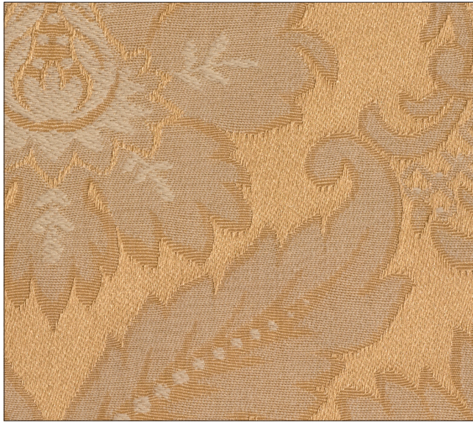
dritto / front