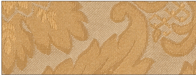
rovescio / back