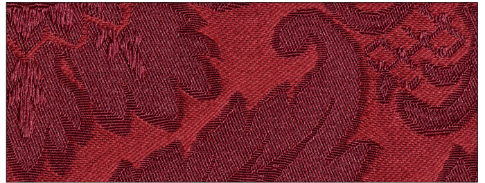
rovescio / back