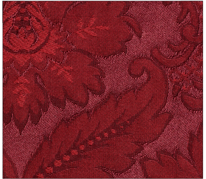
dritto / front