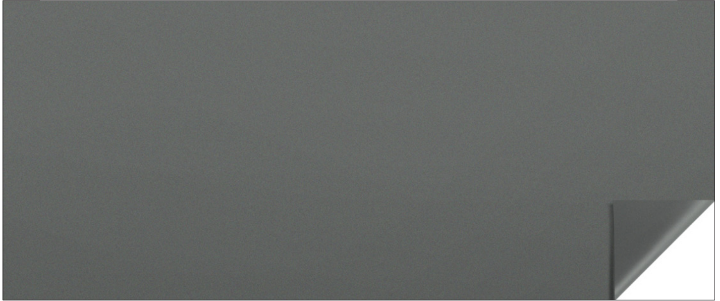
Grigio / Grey