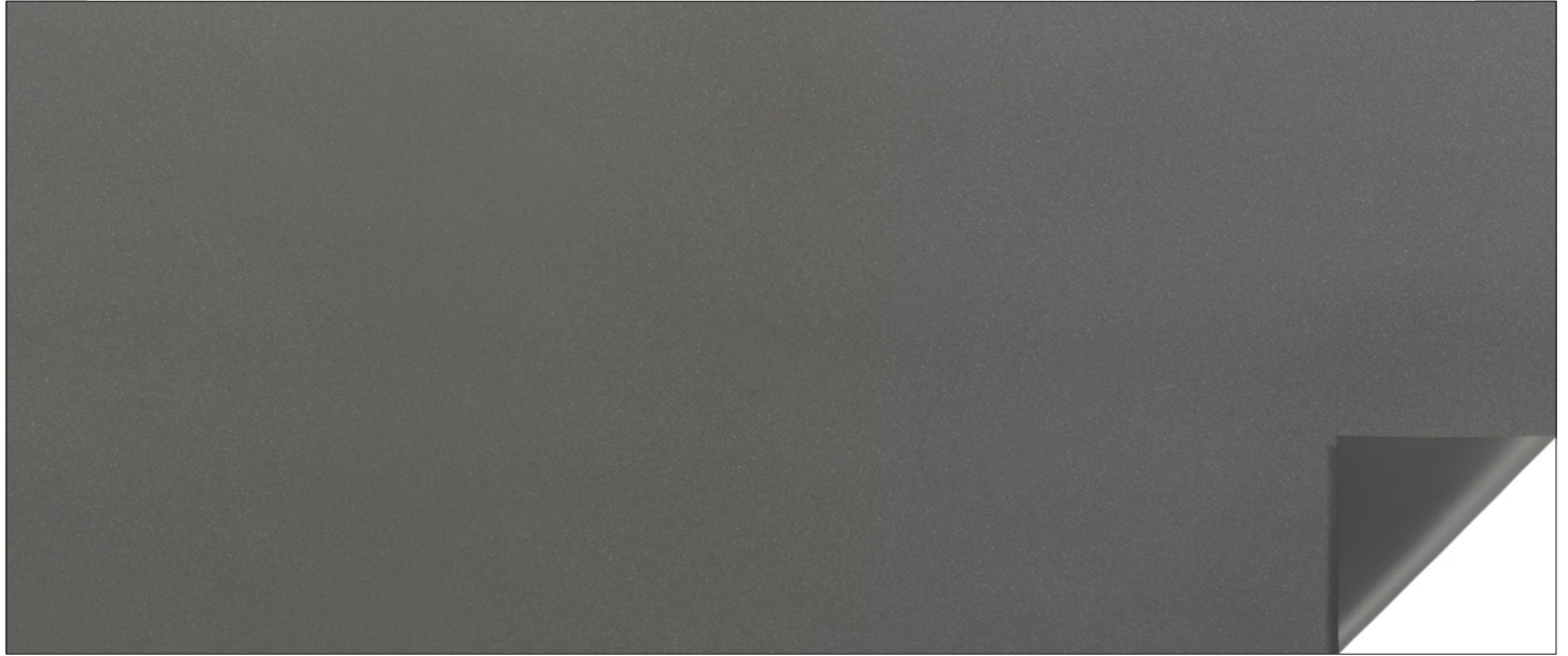
Grigio / Grey