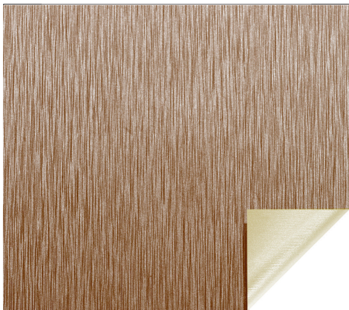
02 - Oro / Gold