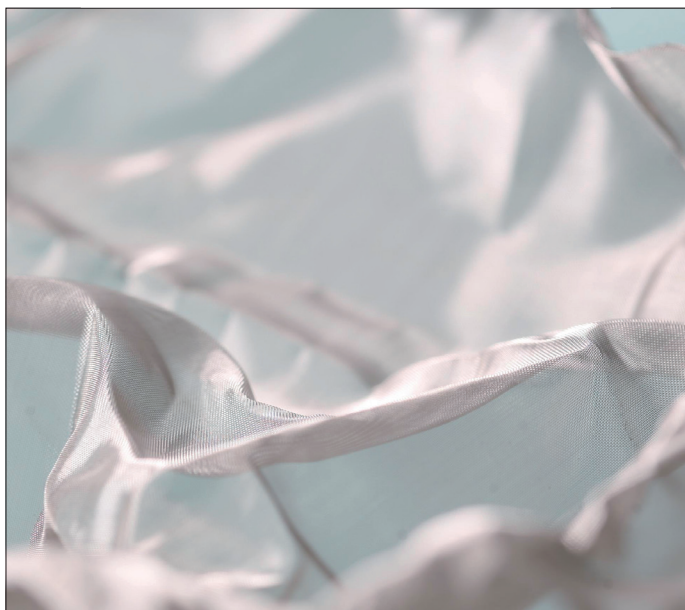
00 - Acciaio inox / Stainless steel

TESSUTO MODELLABILE IN ACCIAIO / MOULDABLE STEEL FABRIC