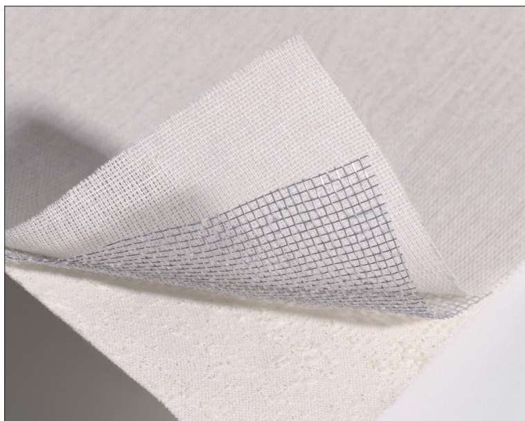
00 · Naturale / Natural